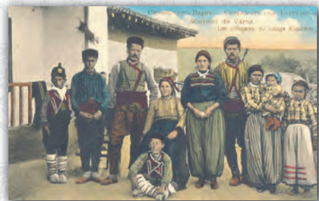
Гагаузко семейство в традиционно облекло пред къщата си