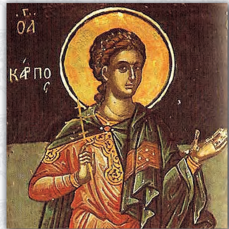
Свети апостол Карп

Св. ап. Карп се числи къмъ 70-те апостоли на Христос (I—IV в.), помощник на св. апостол Павел. Споменаван е във Второ послание до Тимотей: „Когато дойдеш, донеси фелона, който оставих в Трояда, при Карпа, и книгите, особено кожените“ (2 Тим. 4:13).