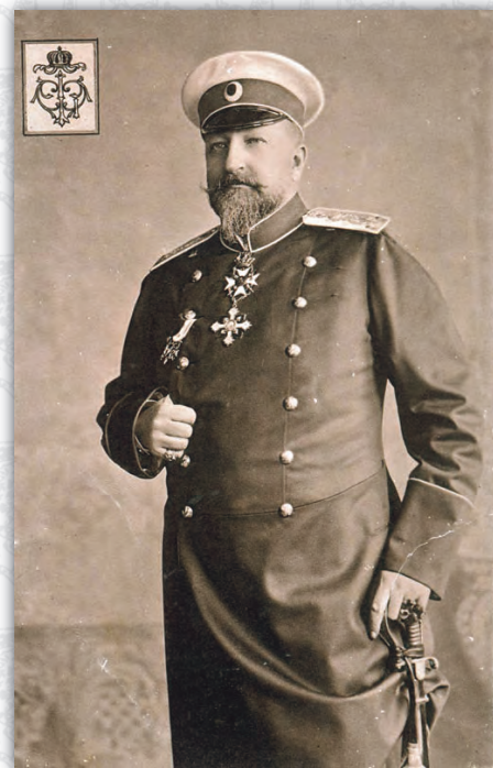
Цар Фердинанд I

Следъ изграждане зданието на Варненската девическа гимназия и започване учебнитѣ занятия въ него — тогазъ и азъ бѣхъ учителъ тамъ — Георги Живковъ дойде презъ септемврий 1898 г. въ Варна и въ срещата що имахъ съ него, после напуцането съ честь и доблестъ министерския постъ, той ми каза, между друго: „Ще се намѣрятъ хора