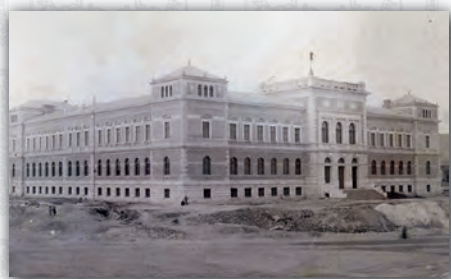
Варна. Девическа гимназия „Мария Луиза“