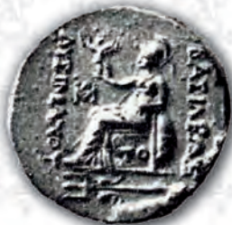
Монети от Одесос

при едната монета отгоре е разклоненъ въ видъ на кръстче, при другитѣ — недопечатанъ. Престолътъ е безъ подпорка, само при едната личатъ горнитѣ върхове на низка подпорка, до главата на Зевса.