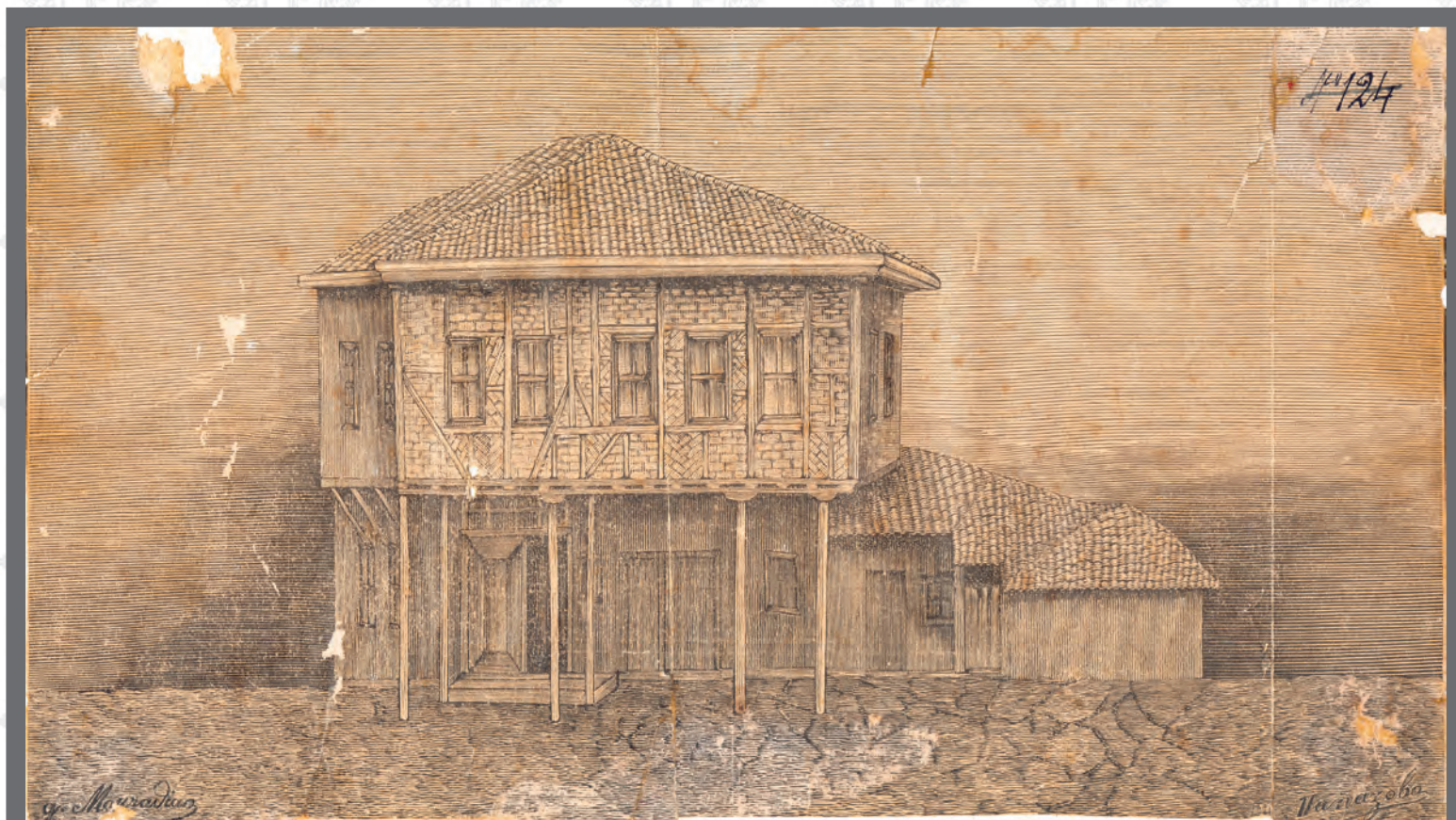
Скица на първото българско училище във Варна от Урания Папазова