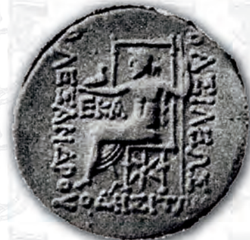
Монети от Одесос