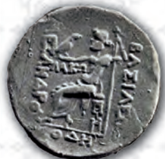
Монети от Одесос