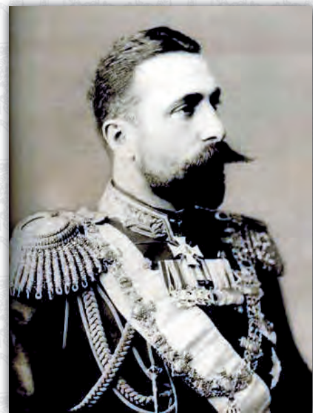
Княз Александър I Батенберг

Ученичкитѣ бѣха съ бѣли хубави дрехи съ ленти презъ рамо и китки въ ръже. Лентитѣ на българскитѣ ученички