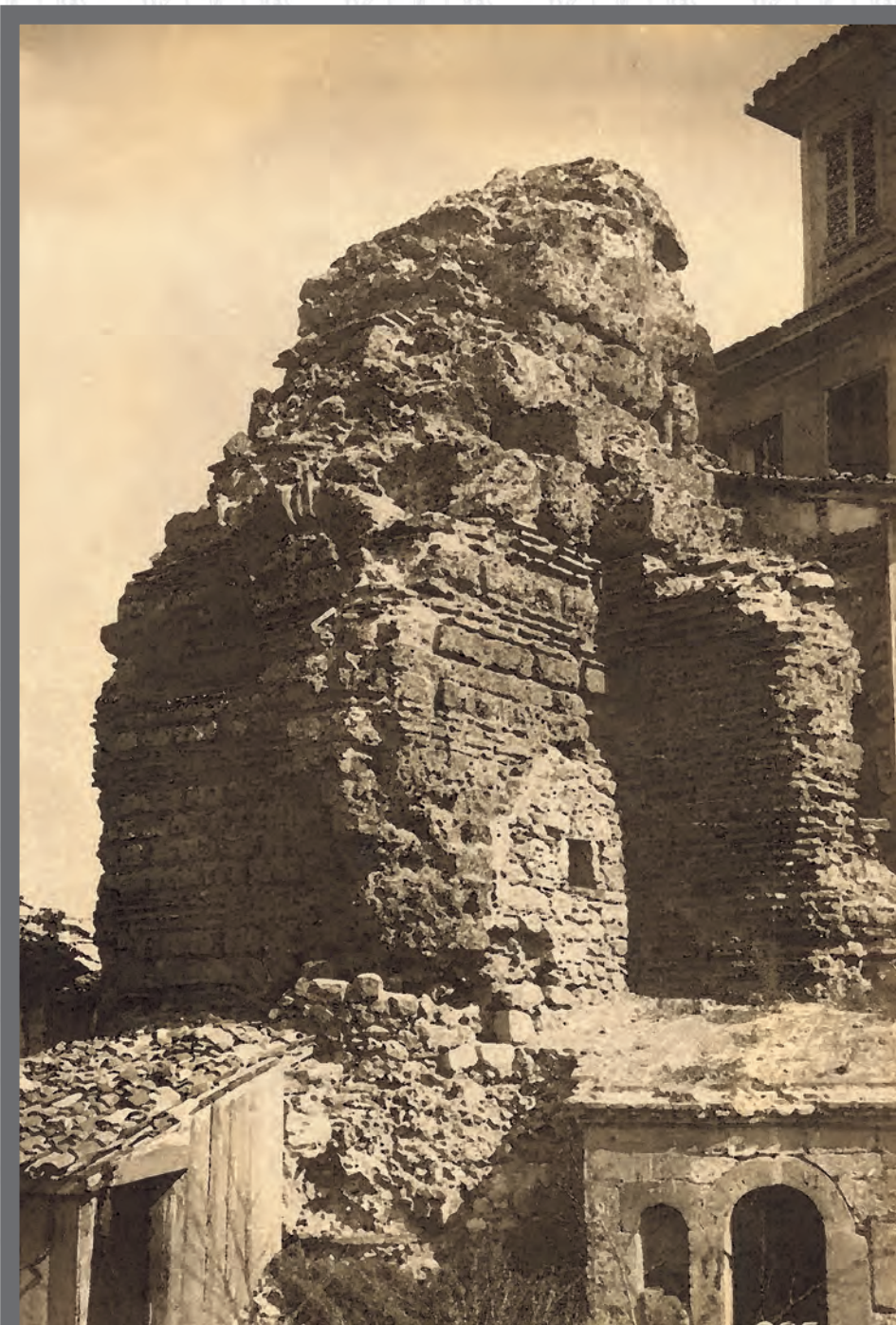
Варна. Римските терми