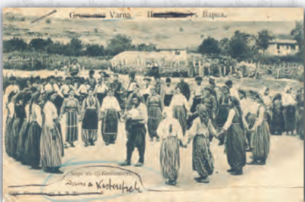
Хоро в с. Кестрич

и сщцо. В. Мошковъ ги счита за потомци отъ други тюркски племена (Извѣстия Импер. Русск. Географ. Общества XI, 3), а К. Шкорпилъ — за потомци на древнитѣ българи (Извѣстия Русск. Археол. Института въ Константинополь, X, стр. 28 1 ; 554; 561 2 ). Той пише: „Какво стана съ първитѣ неславянски българи? възможно ли е този народъ, който е победявалъ, да е изчезналъ напълно въ разстояние на две столѣтия и да се е слѣлъ съ славянския елементъ, на който характерътъ е билъ съвсемъ противенъ на характера на старитѣ българи? и много други въпроси, за които нито за отговоритѣ тукъ имъ е мѣстото. Дойдохме до едно мнение, че сегашното мохамеданско население въ Дели-ормана „гаджали“ и може би и християнскитѣ гагаузи въ Изт. България сж останки на старитѣ неславянски българи (Паметници на гр. Одессосъ — Варна, стр. 6).