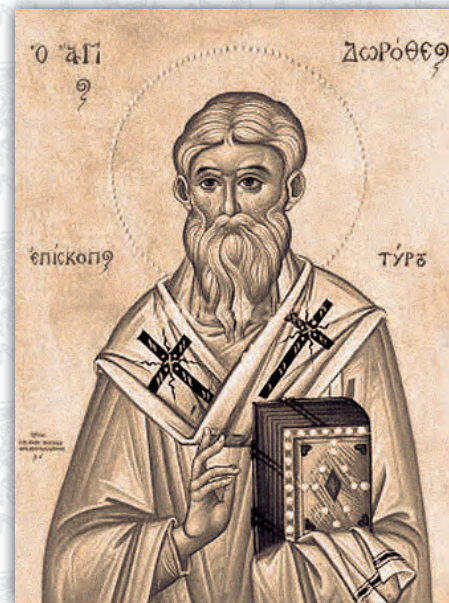
Свети свещеномъченик Доротей, епископ Тирски

Роден е около 255 г. от н. е. Първоначално е избран в Антиохия за презвитер. Изключителен ерудит и учен, владее еврейски и грѣцки, вещ в богословието, философията и ораторското изкуство. Неговите качества впечатляват императора и той „без да бъде принуждаван да се откаже от вярата си (християнството)“ е назначен за надзирател на добива на пурпурни оцветители.