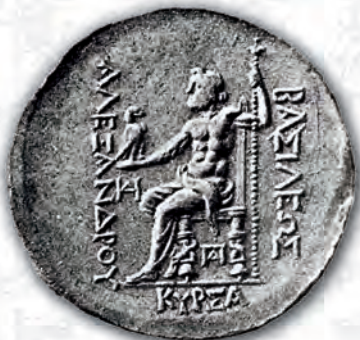
Монети от Одесос